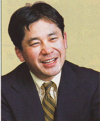
ファイナンシャルリサーチ代表